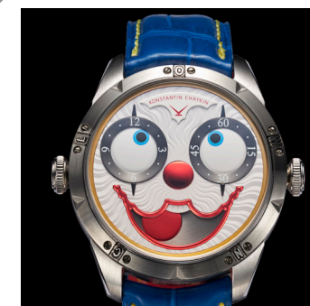
«Клоун 2 Дерзкий». 2019.