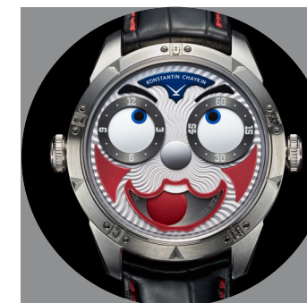
«Клоун Гримальди». 2021.