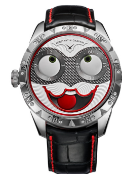
«Арлекин Вентуно». 2021.