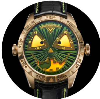
«Зелёный Хэллоуин». 2019.